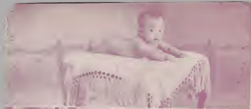
◀ 漫 網 真 天 ▶